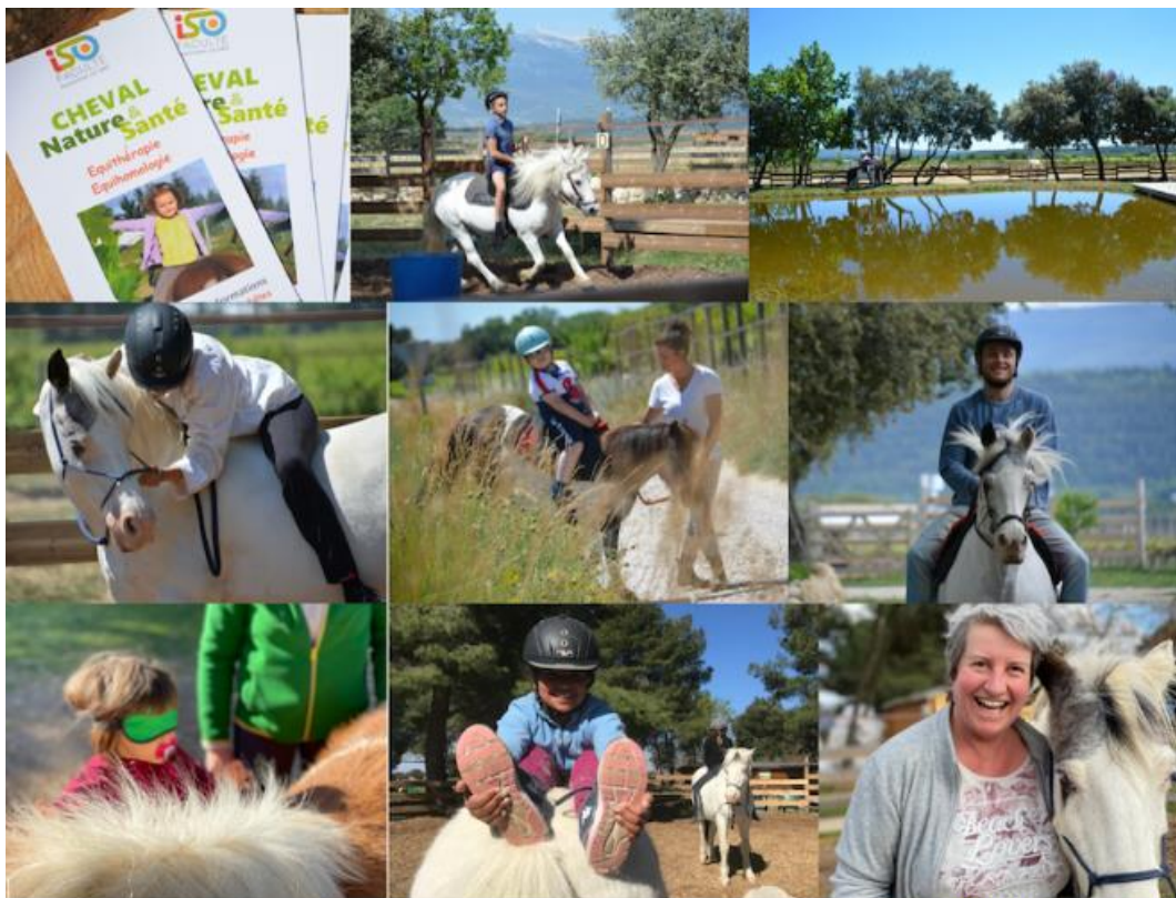
L'équihomologie, c'est top !!